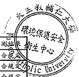
輔仁大學水質檢驗結果一覽表